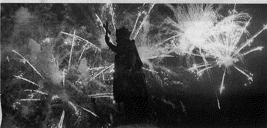
La estatua de Pelayo, con los fuegos artificiales al fondo.