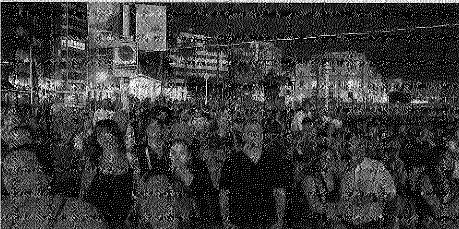
Parte de los asistentes, viendo el espectáculo desde el entorno del Náutico.