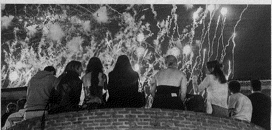
Un grupo de jóvenes en la plazuela de Jovellanos.