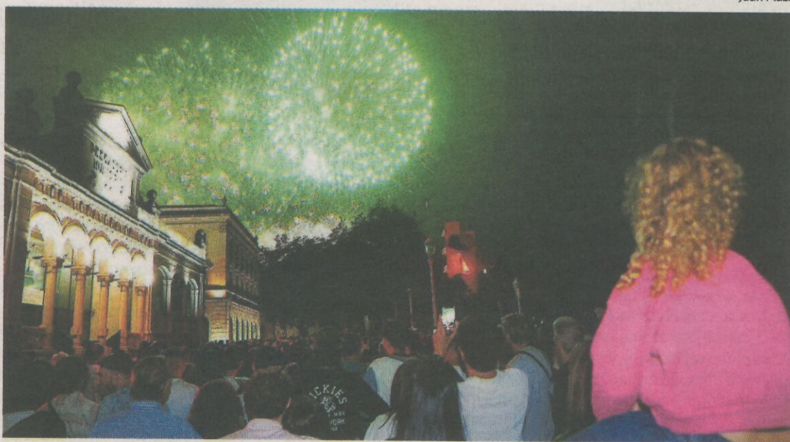
El público, frente a la Antigua Pescadería, siguiendo las explosiones pirotécnicas.