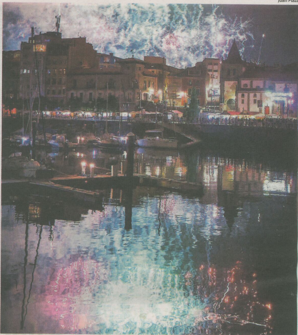
Un instante del espectáculo, con los destellos de las luces reflejados en el agua del Puerto Deportivo.

La seguridad fue máxima durante la Noche de los Fuegos. La Guardia Civil había blindado el Ce-