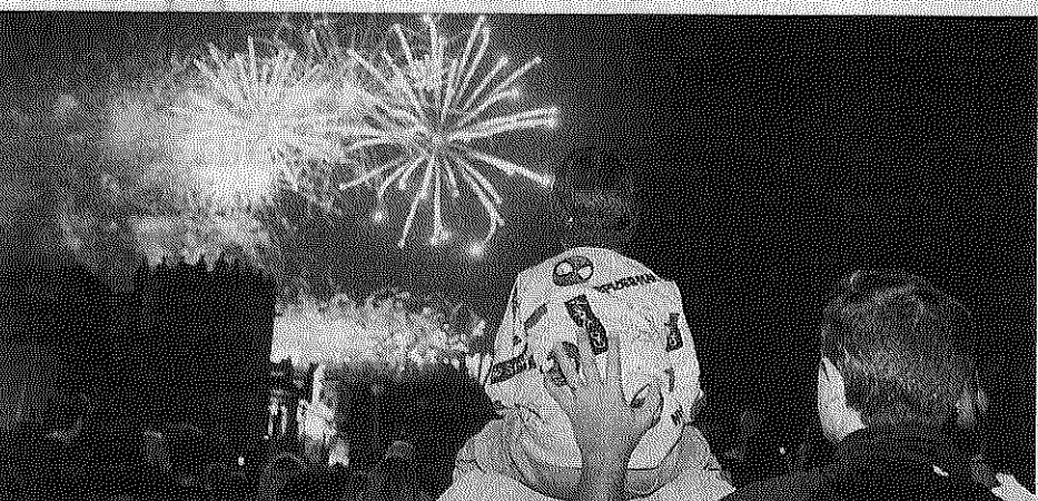
Vista de los fuegos desde la plaza del Marqués.