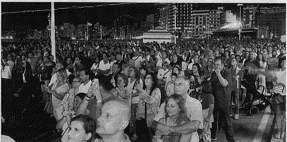
Ambiente en la calle Cabrales a la altura de la Rampla.