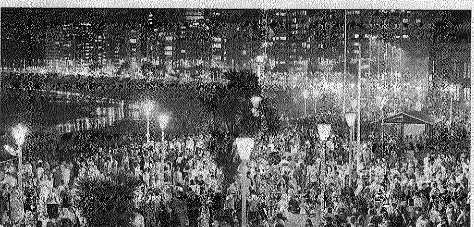
Ambiente en la playa de San Lorenzo, con el Náutico a rebosar.

traca final, con más de un millar de detonaciones de calibres variados, provocó un rugido colectivo que se tuvo que escuchar, seguramente, hasta Roces o Montevil.