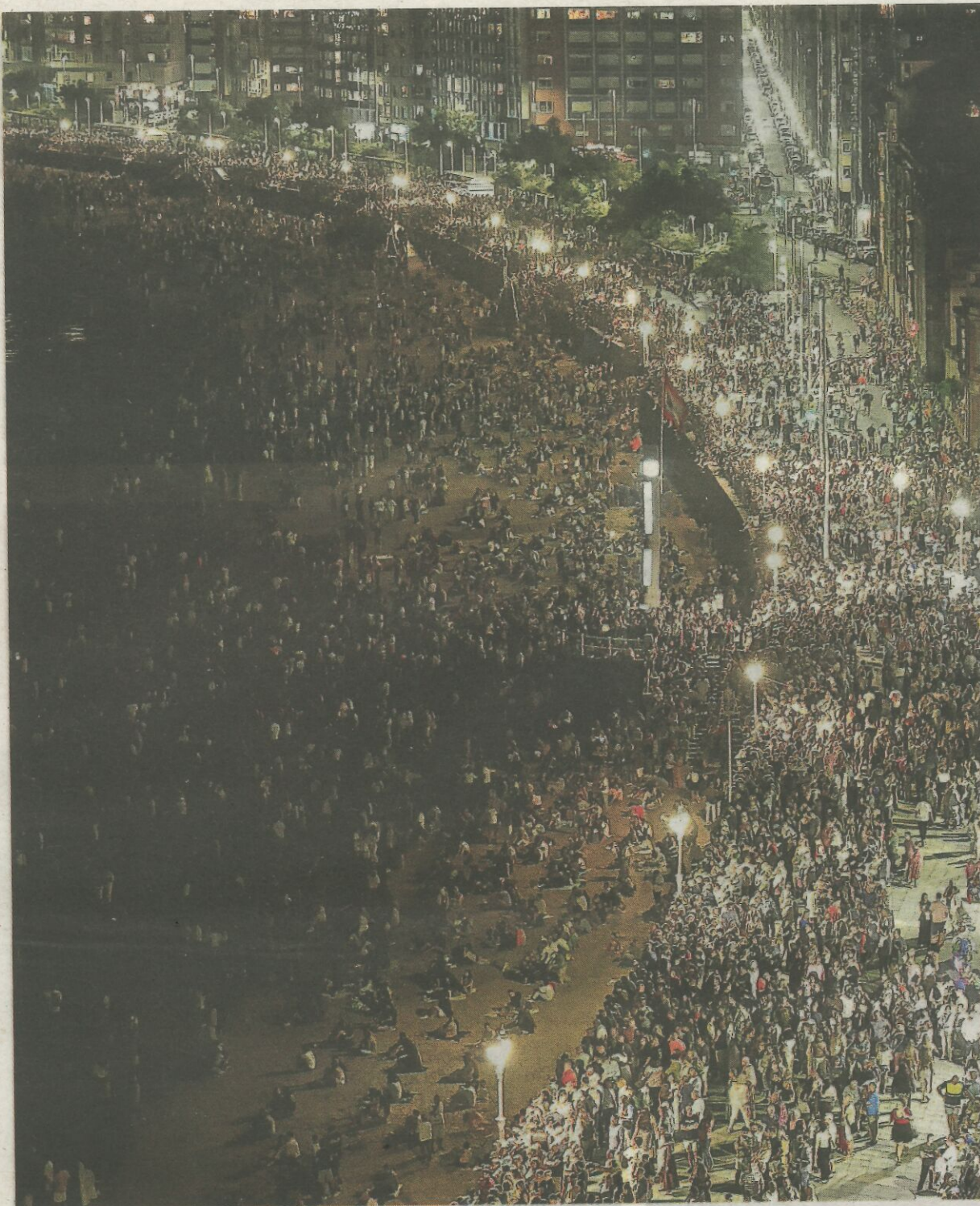
Multitud en la playa para contemplar los Fuegos.