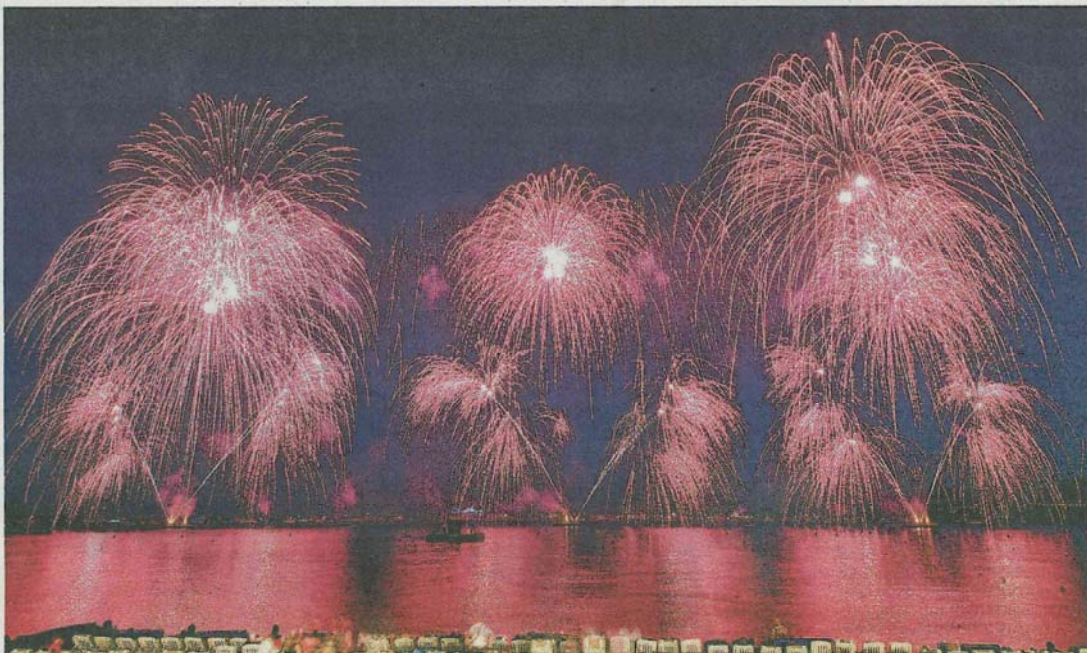
Parte del espectáculo piromusical en Cannes que recrea la atmósfera de 'La vie en rose', popular canción de Édith Piaf. PIROTECNIA ZARAGOZANA

El de Cannes no ha sido el único galardón que Pirotecnia Zaragozana ha recogido este verano. Los cohetes aragoneses iluminaron también el cielo de Ottawa (Canadá) el 8 de agosto en otro festival internacional de fuegos artificiales del que también se trajeron un primer premio. Miguel asegura que lo de Canadá fue más sencillo. «Era una barca, mucho más grande que las de Cannes, pero solo una, mientras que en la ciu-